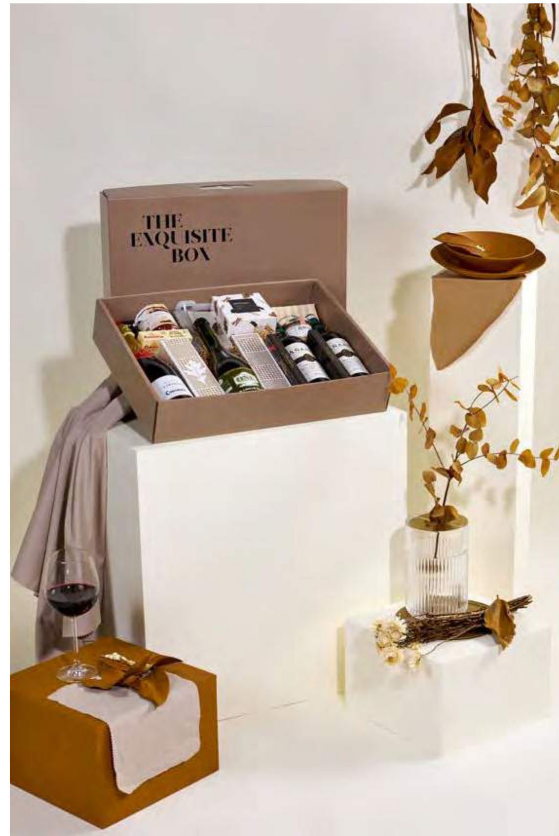
Lote The Exquisite Box 318 REF. 2D2CTEB318 · 49,50€ 56,15€ IVA INC.