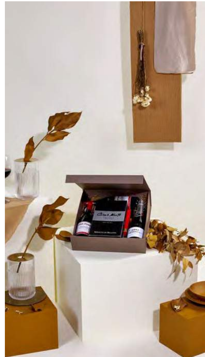
Caja Lujo The Exquisite Box 308 REF. 2D2CTEB308 · 74,21€ 84,39€ IVA INC.