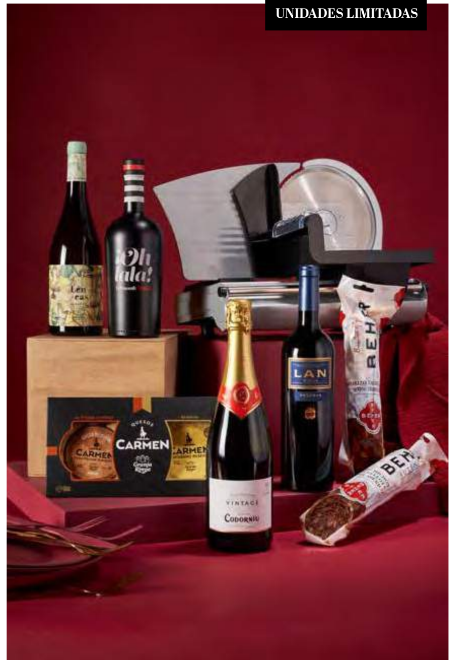
REF. 2D2C117R _ Estuche Regalo 117R · 97,03€ 114,38€ IVA INC.