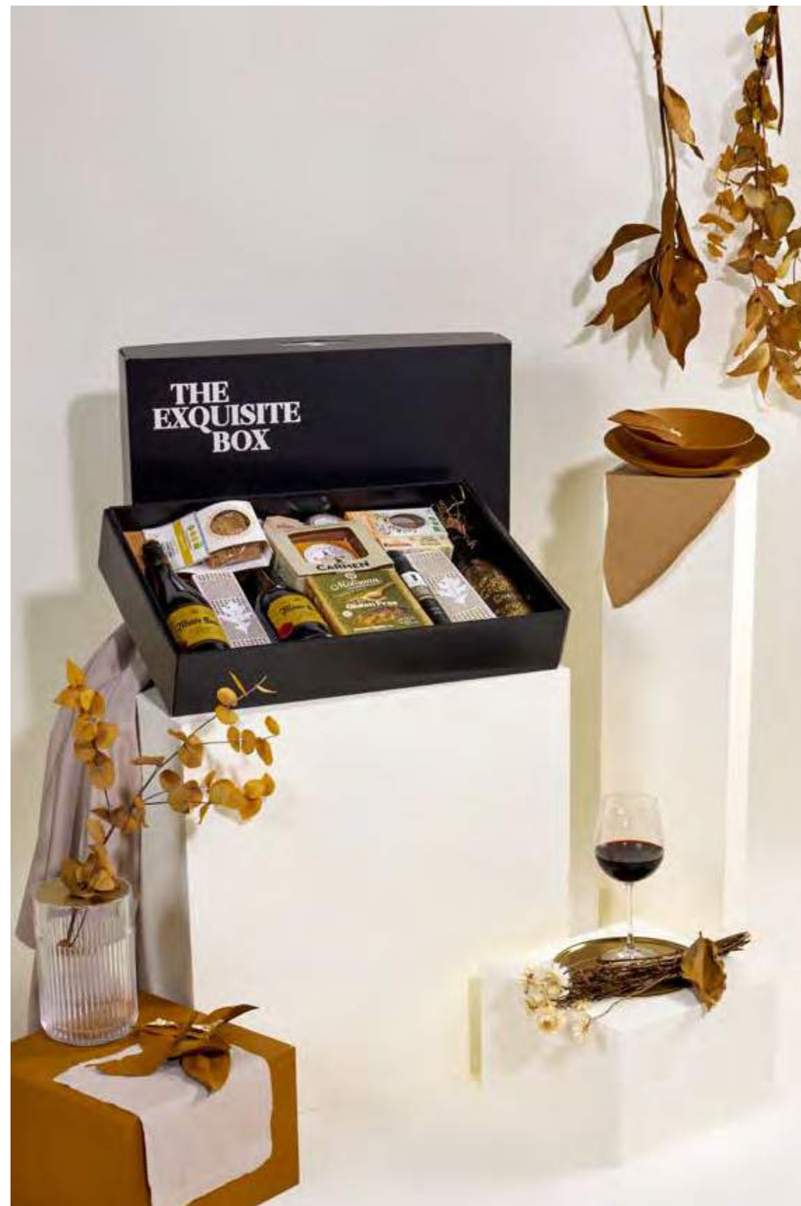
Lote The Exquisite Box 313 APTO CELÍACOS REF. 2D2CTEB313 · 59,36€ 67,12€ IVA INC.