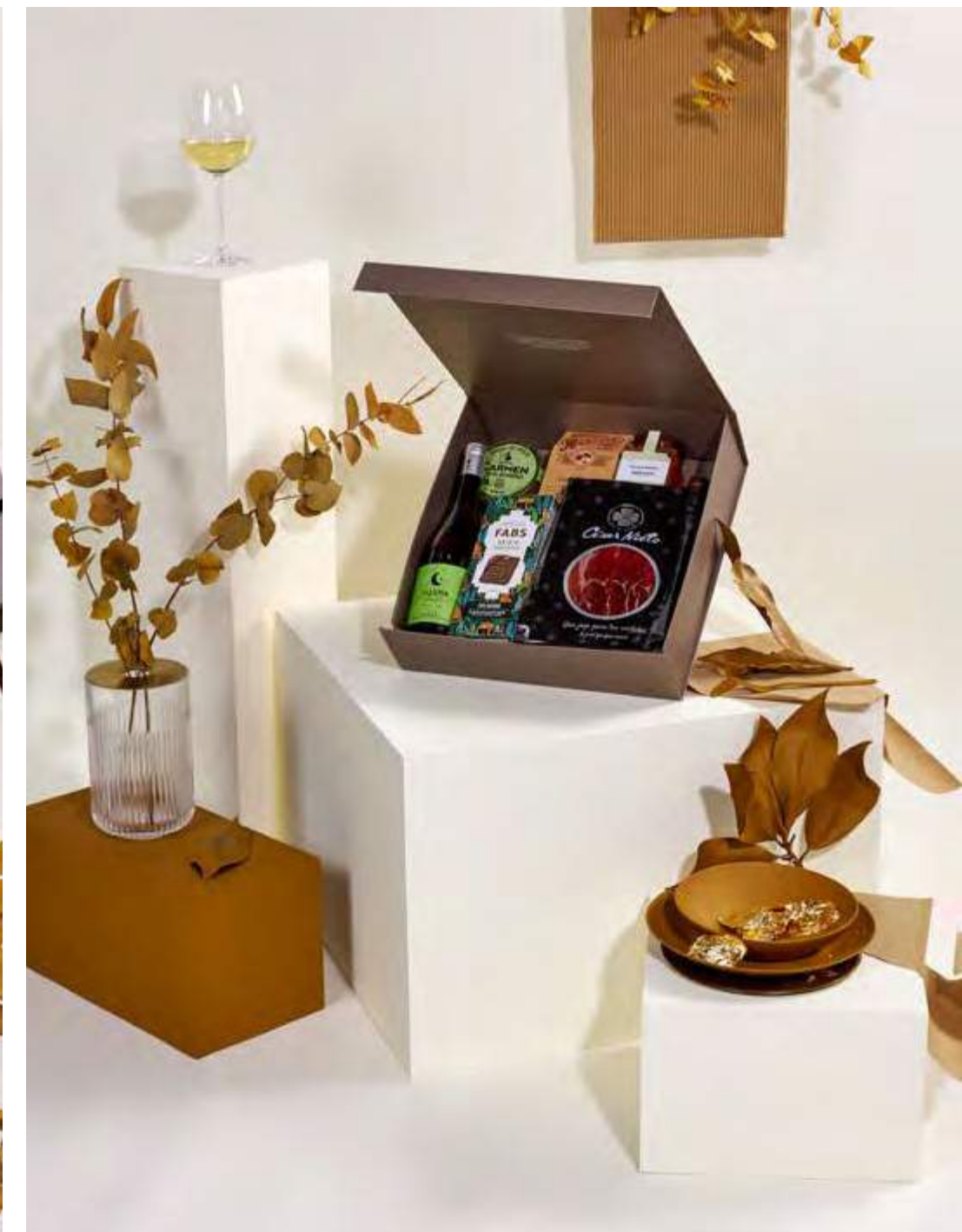
Caja Lujo The Exquisite Box 310 REF. 2D2CTEB310 · 64,09€ 71,85€ IVA INC.