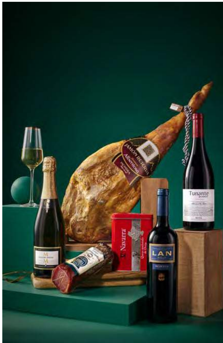
REF. 2D2C205J_ Estuche Jamonero 205J • 89,34€ 99,64€ IVA INC.