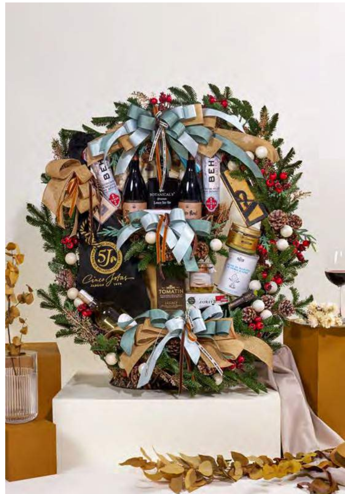
Cesta The Exquisite Box 302 REF. 2D2CTEB302 · 442,53€ 503,41€ IVA INC.