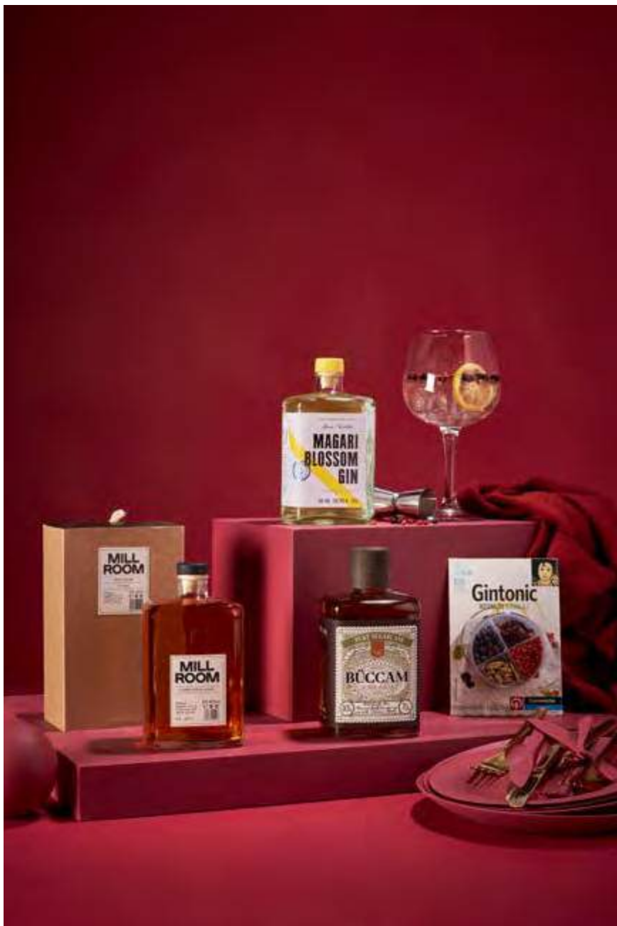
REF. 2D2C116R _ Estuche Regalo 116R · 56,48€ 67,95€ IVA INC.