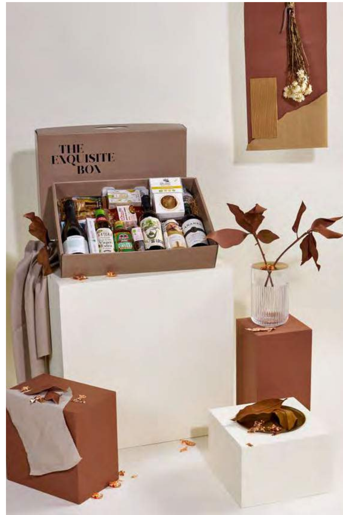
Lote The Exquisite Box 315 VEGANO REF. 2D2CTEB315 · 58,13€ 65,93€ IVA INC.