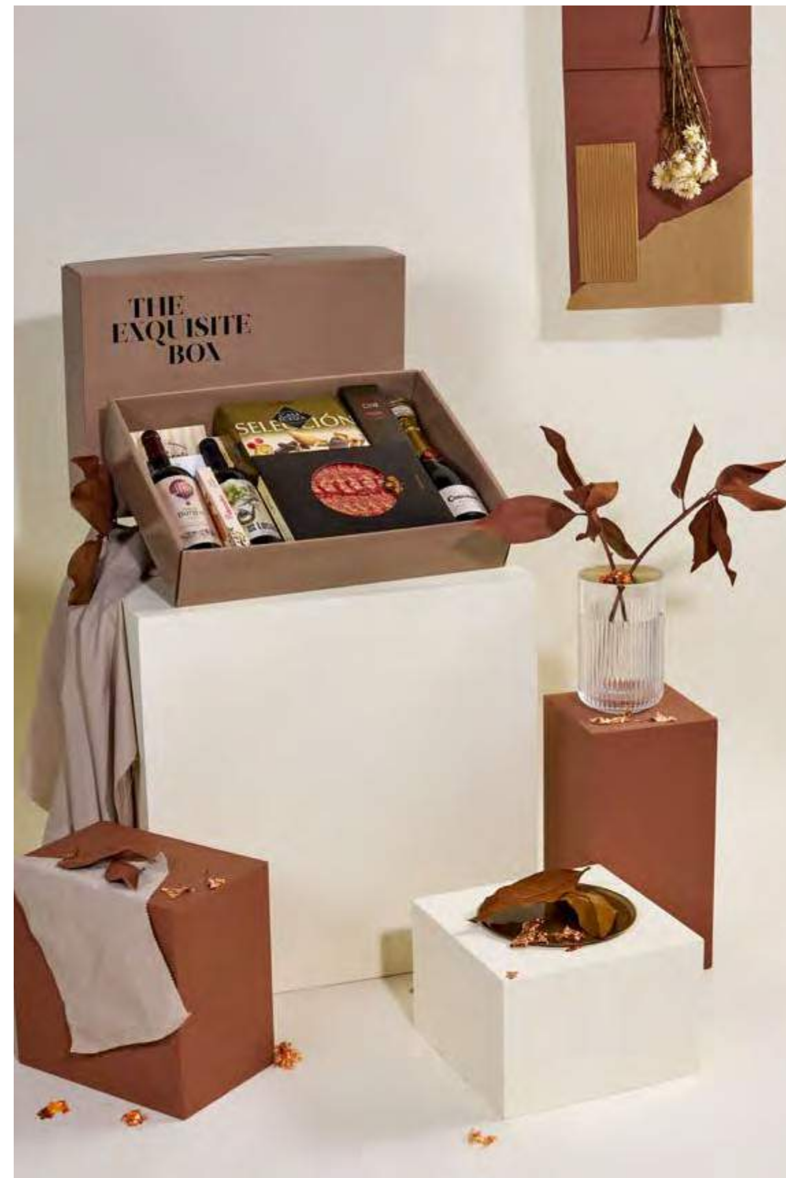
Lote The Exquisite Box 309 REF. 2D2CTEB309 · 68,89€ 77,24€ IVA INC.