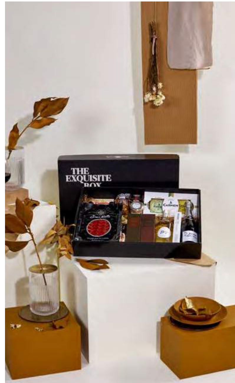
Lote The Exquisite Box 306 REF. 2D2CTEB306 · 84,69€ 95,92€ IVA INC.