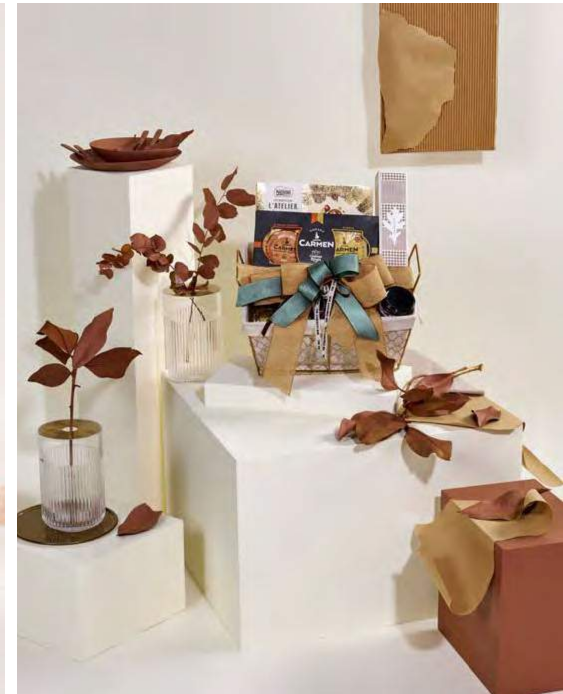
Cesta The Exquisite Box 317 REF. 2D2CTEB317 · 52,65€ 60,58€ IVA INC.