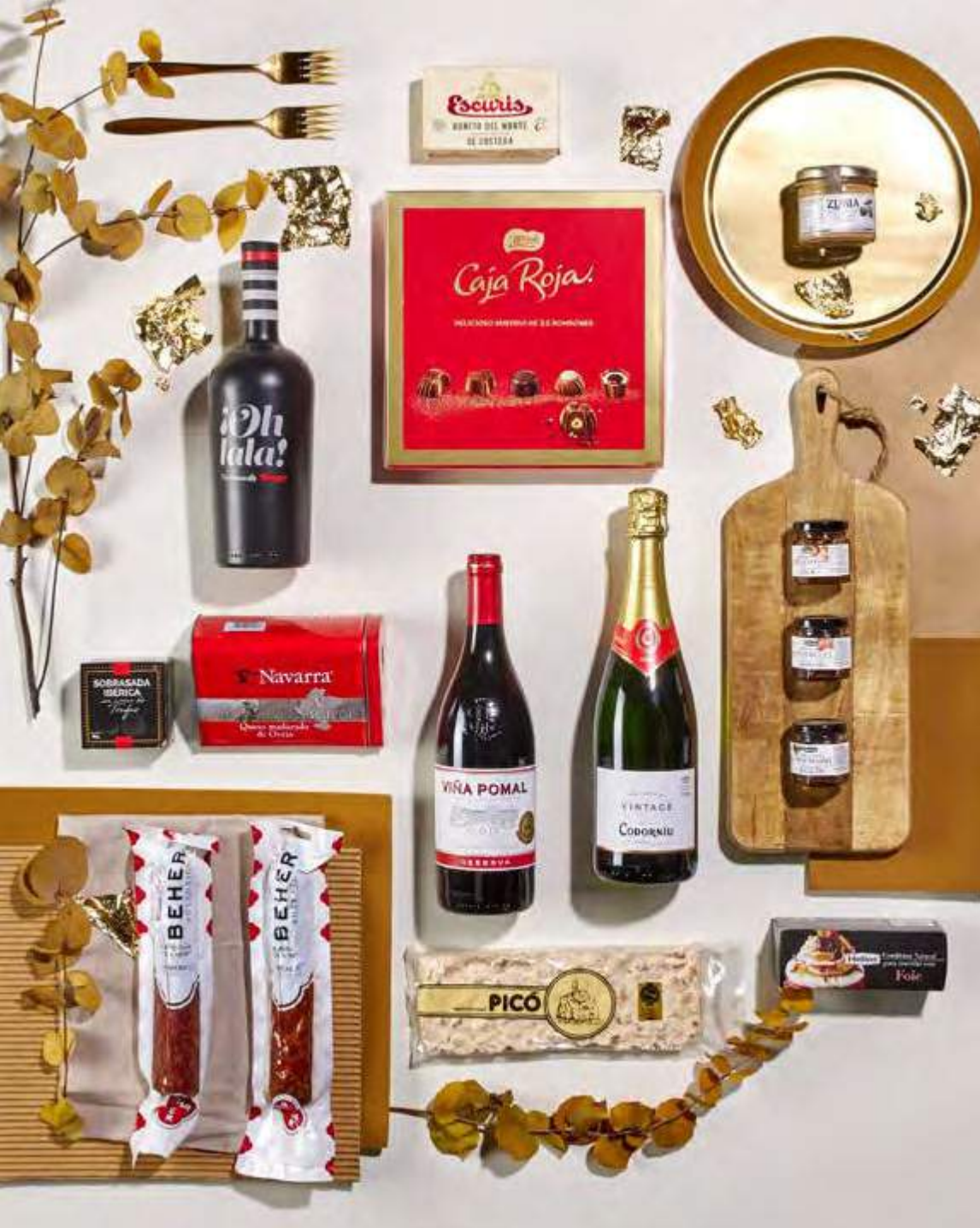
Cesta The Exquisite Box 311 REF. 2D2CTEB311 · 62,18€ 71,64€ IVA INC.