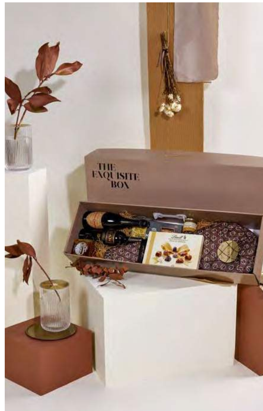
Jamonero The Exquisite Box 305 REF. 2D2CTEB305 · 121,82€ 136,36€ IVA INC.