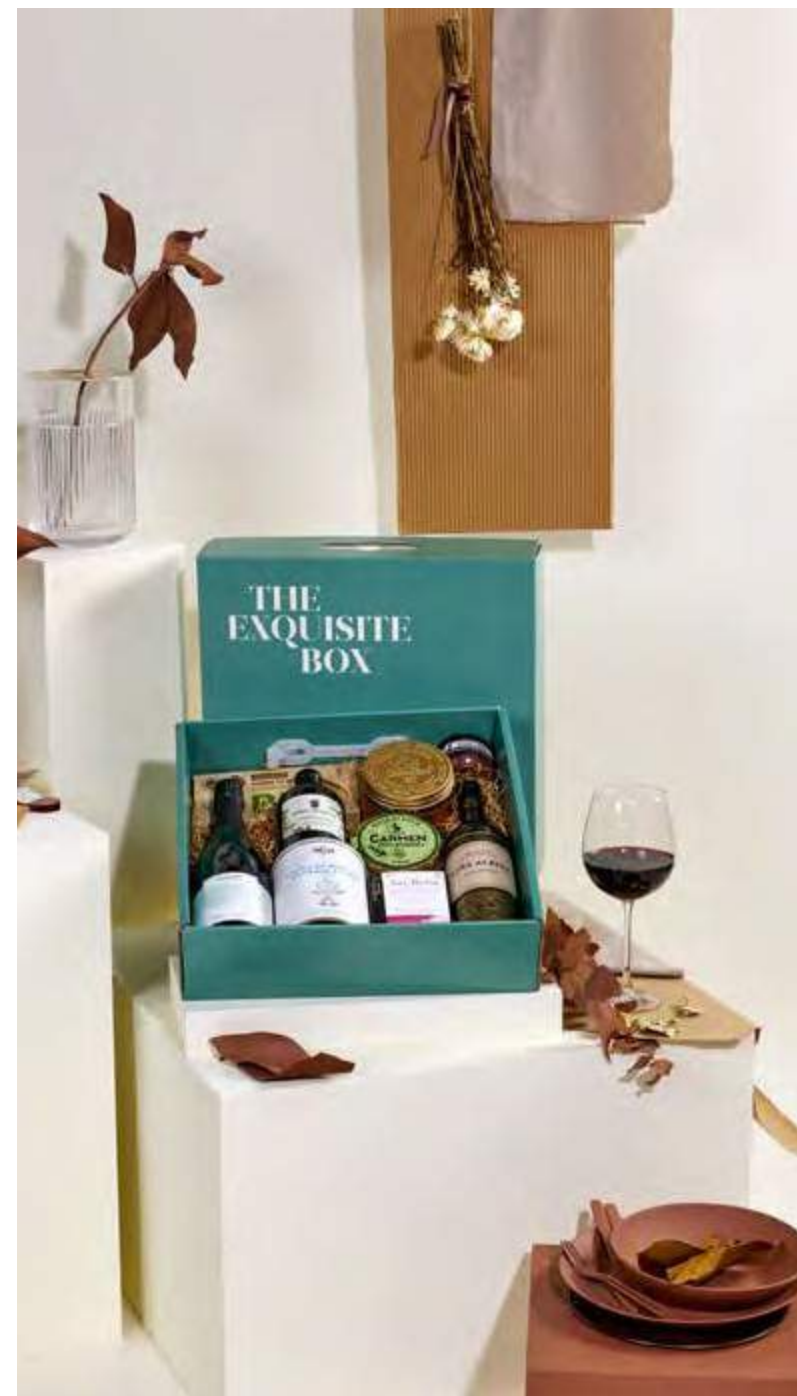
Lote The Exquisite Box 316 REF. 2D2CTEB316 · 57,34€ 65,19€ IVA INC.