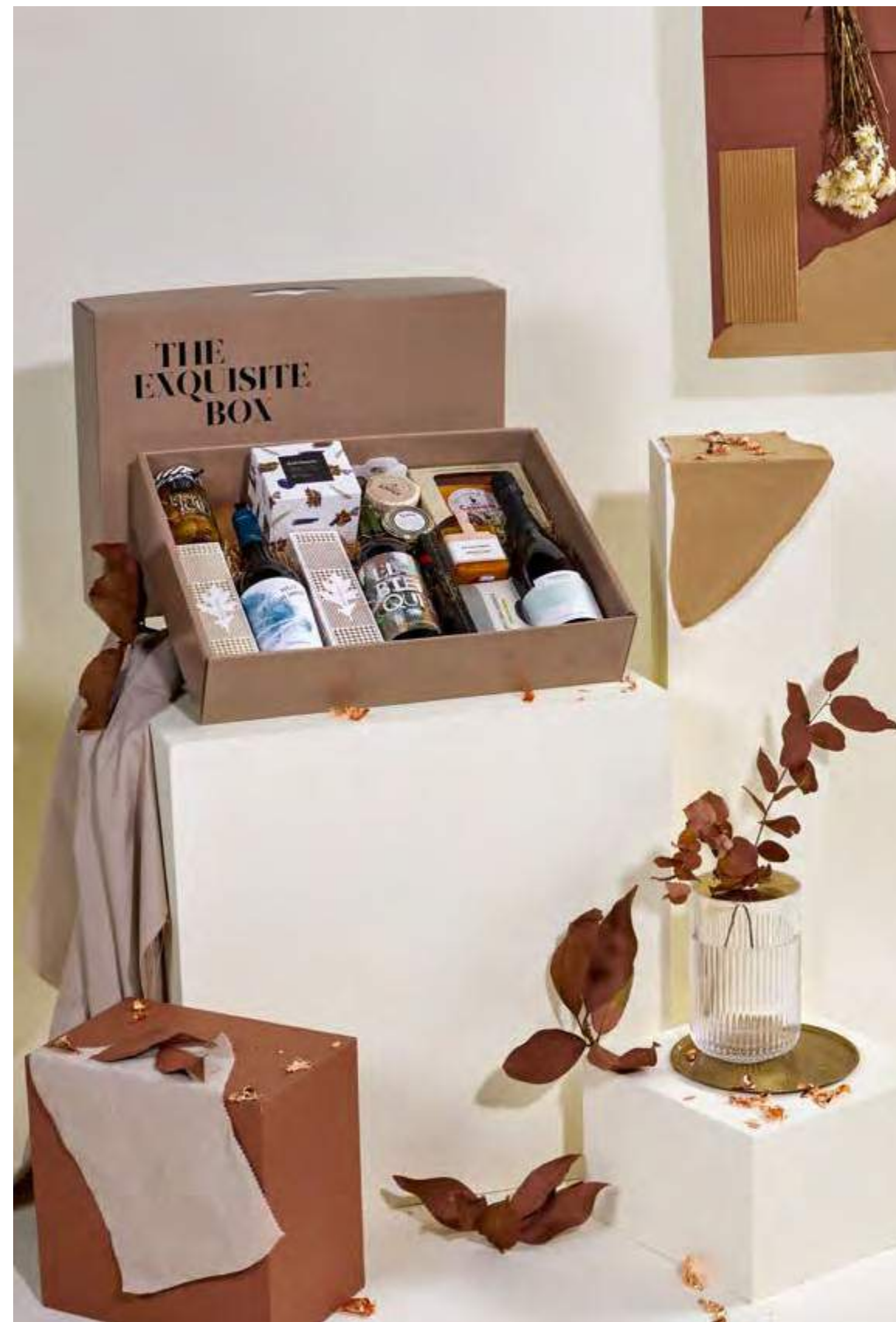
Lote The Exquisite Box 320 REF. 2D2CTEB320 · 47,43€ 54,01€ IVA INC.