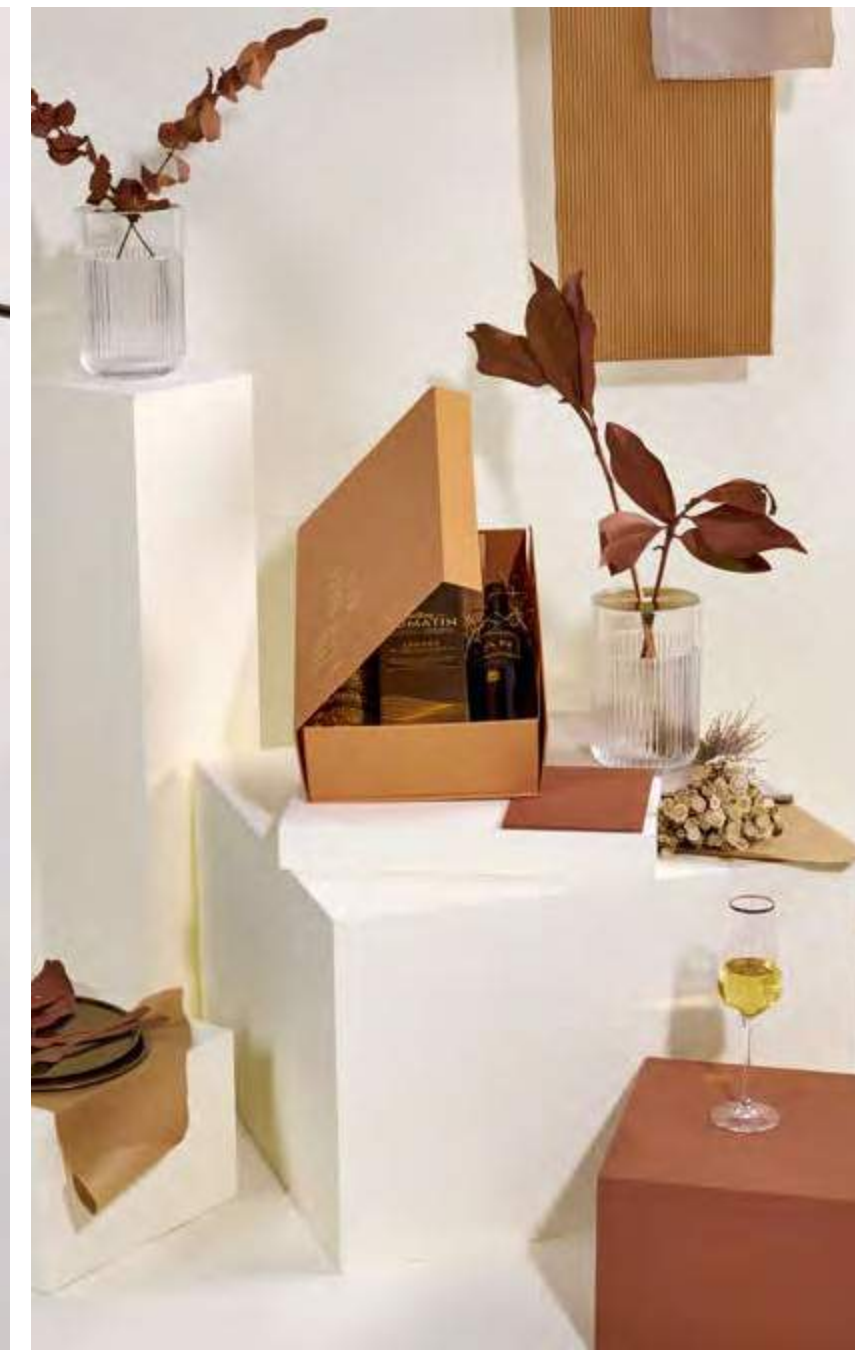
Incluye caja plegable lujo decorada