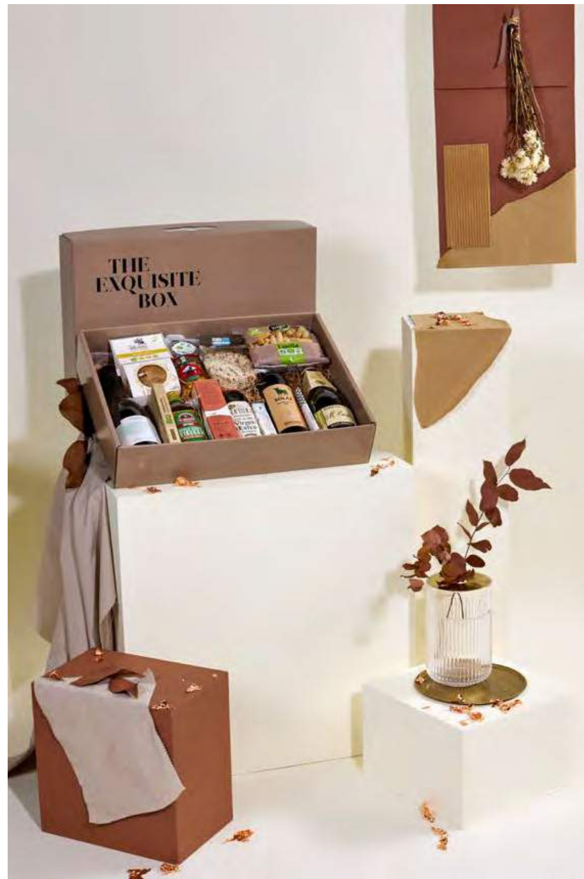
Lote The Exquisite Box 314 ECOLÓGICO REF. 2D2CTEB314 · 58,27€ 65,74€ IVA INC.