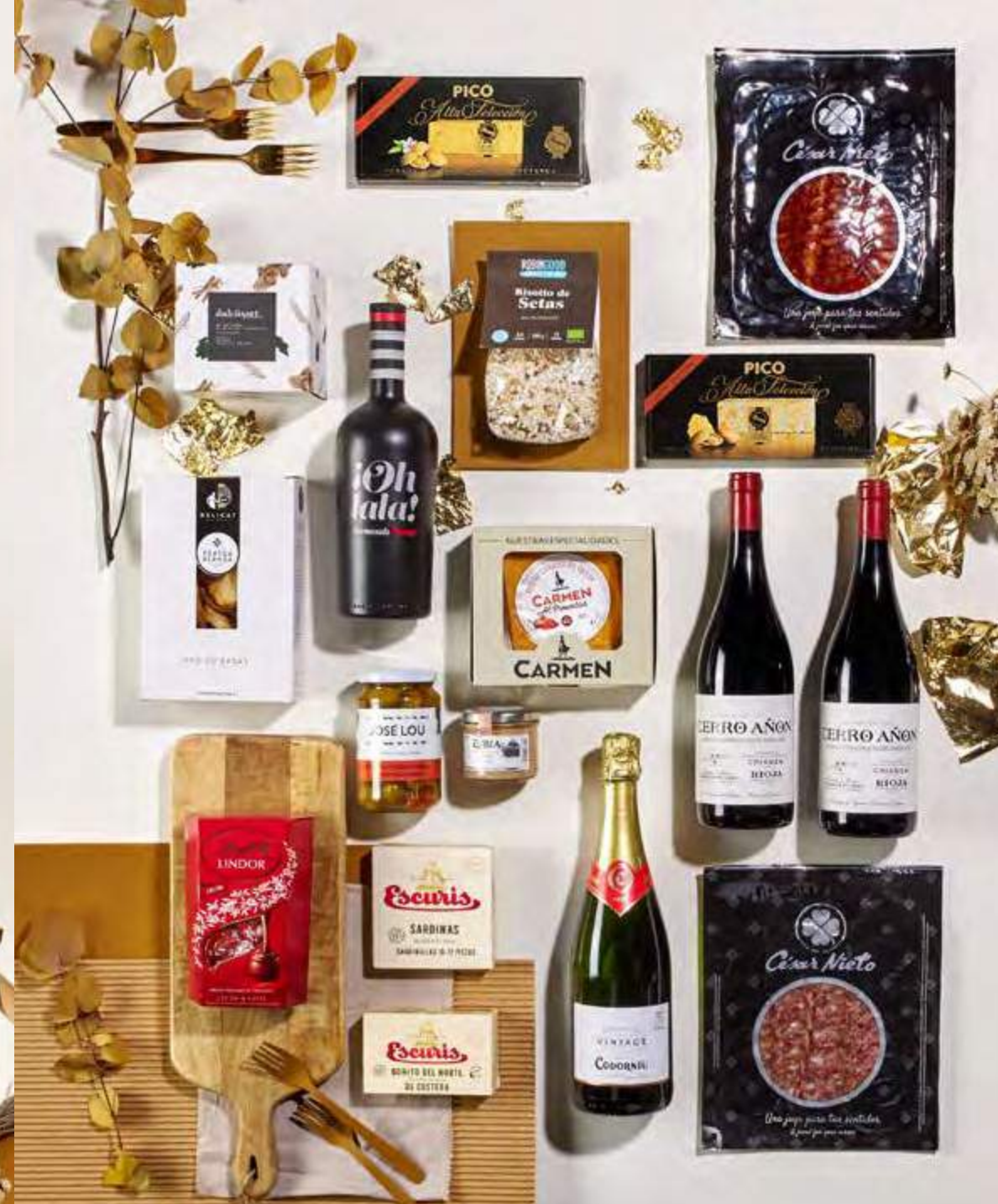
Lote The Exquisite Box 312 REF. 2D2CTEB312 · 61,40€ 69,91€ IVA INC.