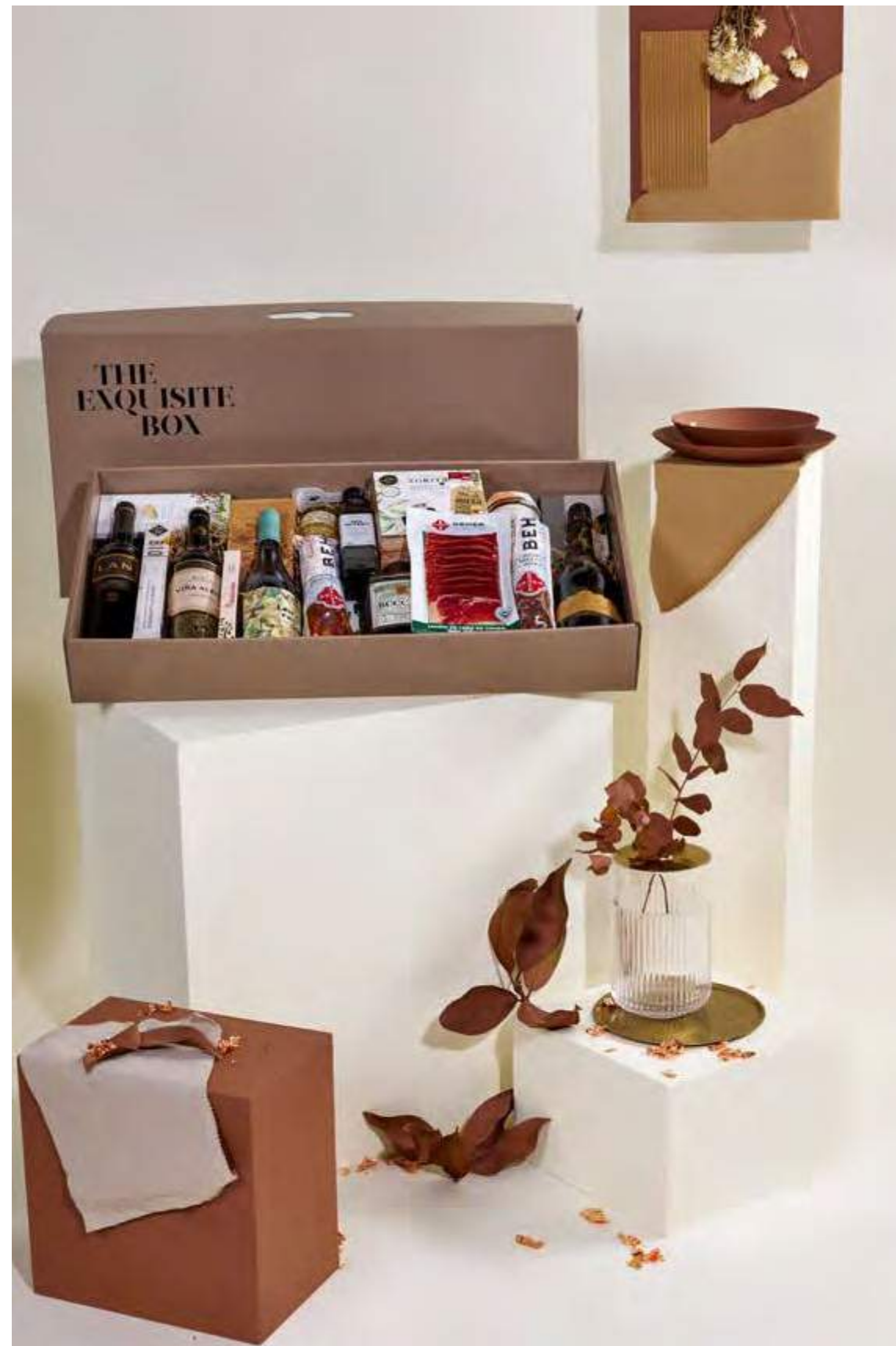
Lote The Exquisite Box 304 REF. 2D2CTEB304 · 128,27€ 145,45€ IVA INC.