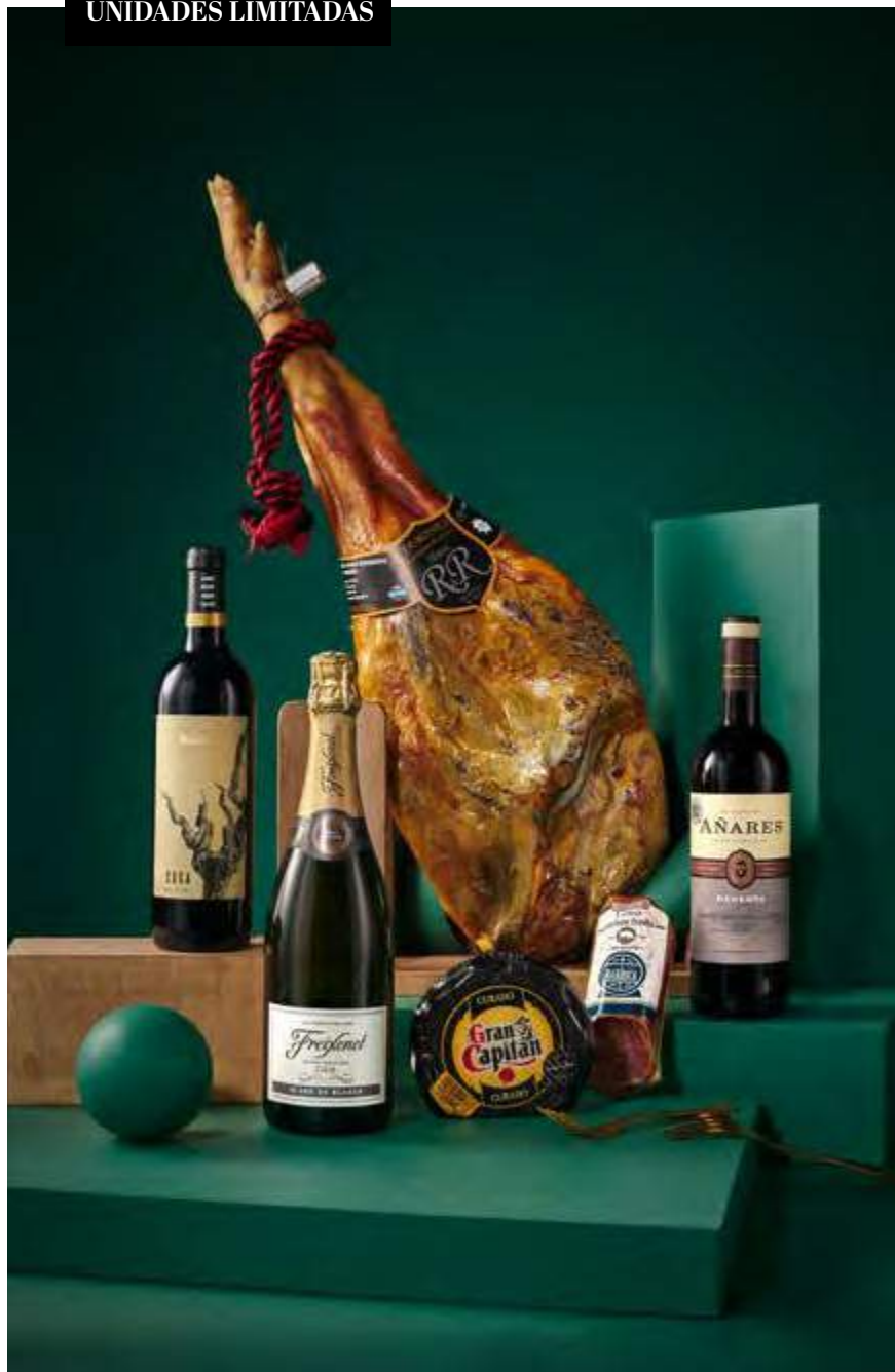
REF. 2D2C204J_ Estuche Jamonero 204J • 85,46€ 95,14€ IVA INC.